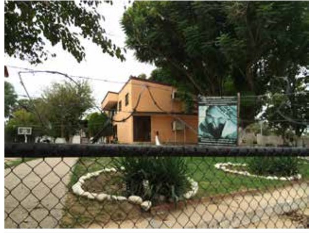
IMAGEN 5 INSTALACIONES DEL ALBERGUE PARA PERSONAS MIGRANTES CONOCIDO COMO CASA DEL MIGRANTE EMMAUS UBICADO EN CIUDAD ACUÑA, COAHUILA