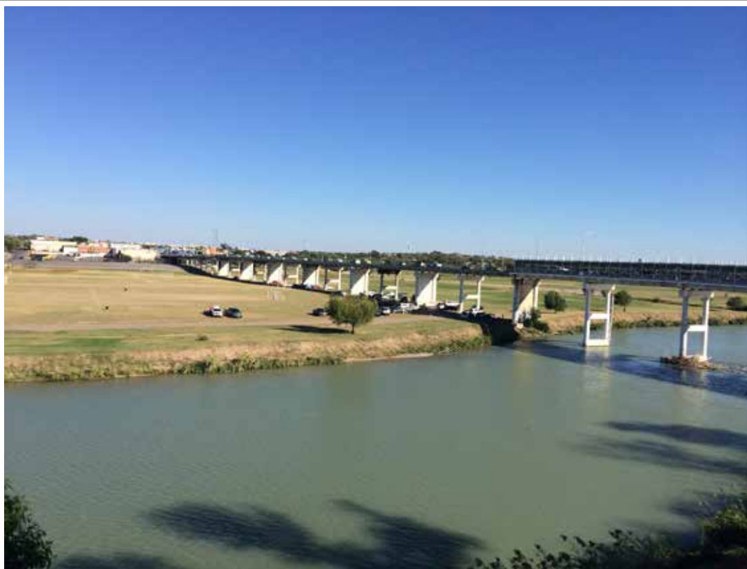
IMAGEN 1 VISTA DEL RÍO BRAVO DESDE LA FRONTERA CON ESTADOS UNIDOS EN PIEDRAS NEGRAS, COAHUILA DE ZARAGOZA.

aborda la situación de las mujeres transmigrantes en el estado de Coahuila con la información recopilada en entrevistas con autoridades, casas de migrantes y