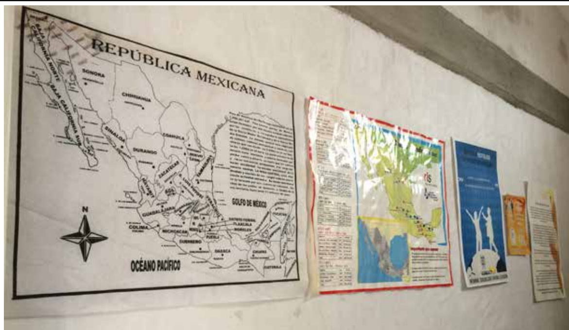
IMAGEN 2 MAPAS PARA ORIENTAR A LAS PERSONAS MIGRANTES EN EL “CENTRO DE DÍA UN PASO A LA ESPERANZA” UBICADO EN TORREÓN, COAHUILA.

Las personas migrantes en tránsito por México han obtenido especial visibilidad, debido a las graves violaciones de derechos humanos que se cometen en su contra, como la masacre de 72 migrantes en San