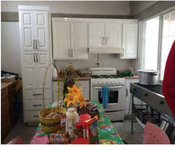
IMAGEN 3 COCINA DEL CENTRO DE DÍA UN PASO A LA ESPERANZA UBICADO EN TORREÓN, COAHUILA