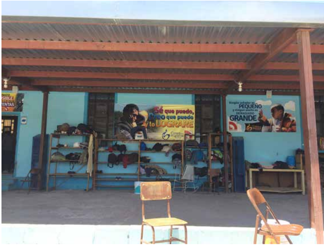
IMAGEN 1 VISTA DE LA CASA DEL MIGRANTE SALTILLO